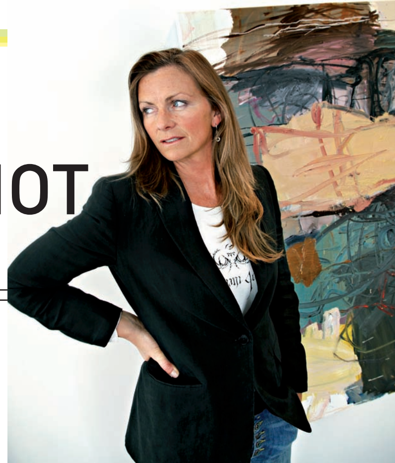
Galleristen foran maleri av Peter Skovgaard (utstilling i april 2009) - Det er tredje gang jeg stiller ut Århus-kunstneren som jobber i Berlin.

Tekst: Leena Mannila, Kunst- og designskribent